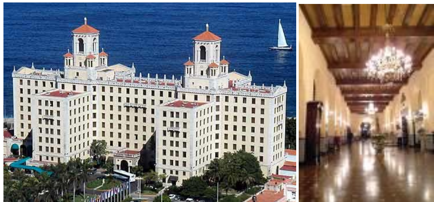
Hotel Nacional de Cuba

kl 1535 ankomst Havana International Airport Egen transport fra flyplassen til hotellet - Hotel Nacional de Cuba