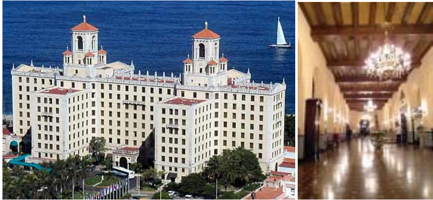
Hotel Nacional de Cuba

kl 1715 ankomst Havana International Airport Egen transport fra flyplassen til hotellet - Hotel Nacional de Cuba