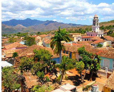
Sightseeing i Trinidad Besøk på La Canchanchara Bar med cocktail