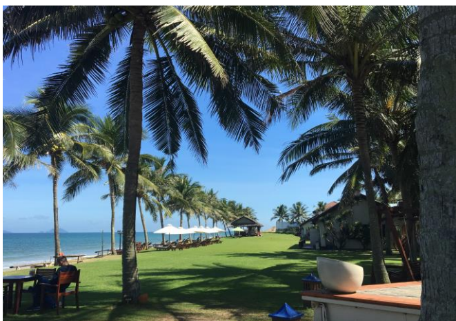
Palm Garden Resort & Spa